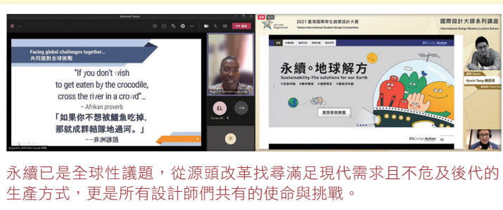
永續已是全球性議題，從源頭改革找尋滿足現代需求且不危及後代的生產方式，更是所有設計師們共有的使命與挑戰。