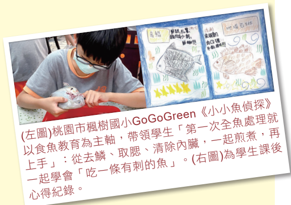
(左圖)桃園市楓樹國小GoGoGreen《小小魚偵探》以食魚教育為主軸，帶領學生「第一次全魚處理就上手」：從去鱗、取腮、清除內臟，一起煎煮，再一起學會「吃一條有刺的魚」。(右圖)為學生課後心得紀錄。

ECO小達人GO GO Green課程以5到7堂主題式帶狀課程，深入探討在地的環境問題，引導孩子對於環保議題有更全面的見解。110學年度上學期於桃園、苗栗、臺中、高雄舉辦 5 梯次，共 32 場(含5場校外教學)課程，相關主題從食魚教育、生態系服務到永續發展議題，截至11月10日，已完成 13 堂課程。