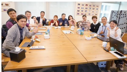
圖1.2019年業師結案會議