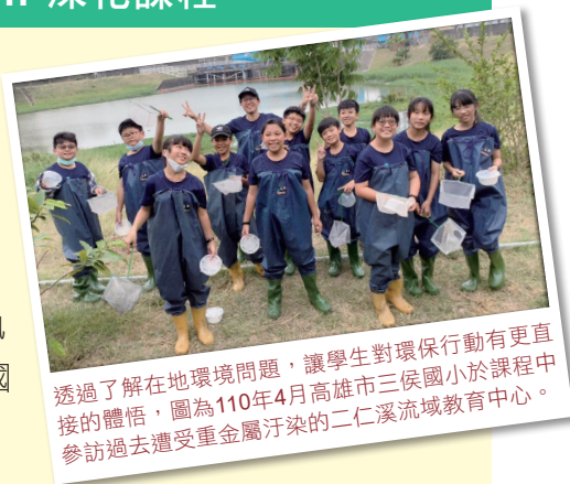
透過了解在地環境問題，讓學生對環保行動有更直接的體悟，圖為110年4月高雄市三侯國小於課程中參訪過去遭受重金屬汙染的二仁溪流域教育中心。

2021年9月15日至12月27日，除原預定桃園市楓樹國民小學、桃園市中原國民小學，因應疫情調整，將上半年高雄市明宗國民小學3次社團課延後執行，更新增與苗栗縣僑成國民小學、台中市東光國民小學之課程安排，將舉辦共 23 場社團活動。