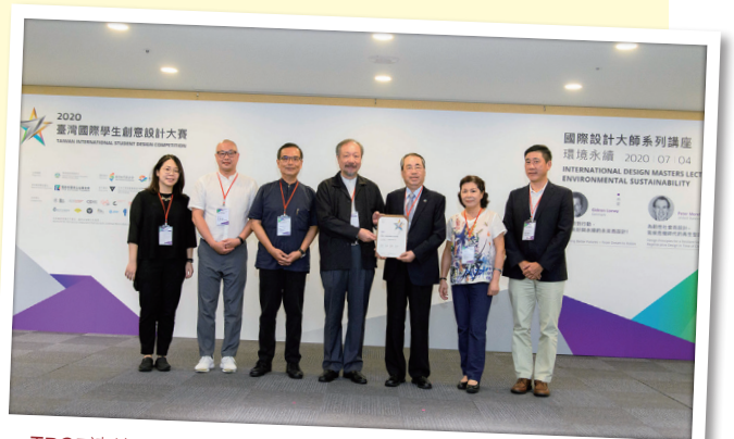
TPCF連續二年贊助臺灣國際學生創意設計大賽—環境永續獎項。

臺灣國際學生創意設計大賽二項環境永續獎徵件活動，自5月1日至7月15日截止，產品設計類共有 4,481 件、視覺設計類共收 16,386 件報名投稿，相關作品將於10月12日進行初選、10月22日完成決選。