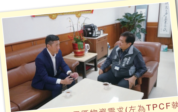
圖1. 拜訪交流復興區物資需求(左為TPCF執行長 右為桃園市復興區區長)