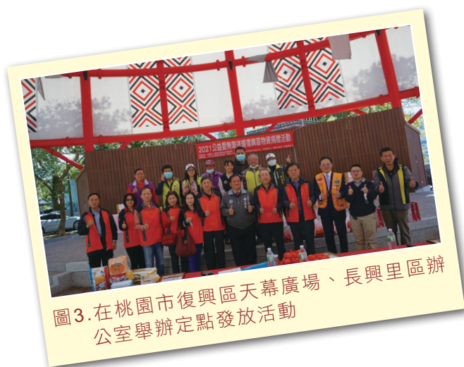
圖3.在桃園市復興區天幕廣場、長興里區辦公室舉辦定點發放活動

獅子會抵達復興區天幕廣場、長興里區辦公室，相繼與復興區十個里的里長見面並分發160箱的愛心食物箱，請里長們協助將物資送至部落的生活困難戶，讓弱勢族群能獲得物資的及時雨。