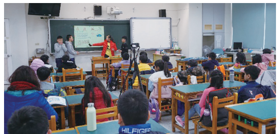
圖5. 為楓樹國小學生至其他班級進行成果發表

「Go Go Green小達人」藉由深入的系列式課程，配合戶外體驗、調研踏查，培養小朋友公民科學的素養，並藉由成果發表會讓小朋友向其他班級、甚至社區倡導說明相關理念，成為下一