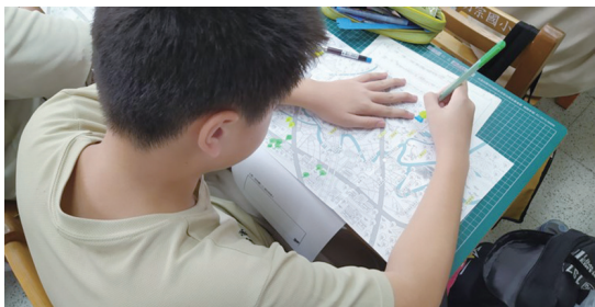
圖2.為明宗國小學生繪製溪流地圖

史，或靠近她去欣賞她的美。感謝TPCF在環境教育深耕，帶給像我們這樣的偏鄉小校難以取得的環境教育資源。」-台南市文賢國小 劉老師