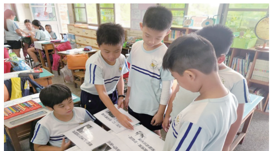
圖1. 為文賢國小學生了解二仁溪歷史