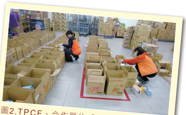
圖2. TPCF、合作單位-全聯中北店工作人員進行160箱食物箱驗收品項及最後封箱